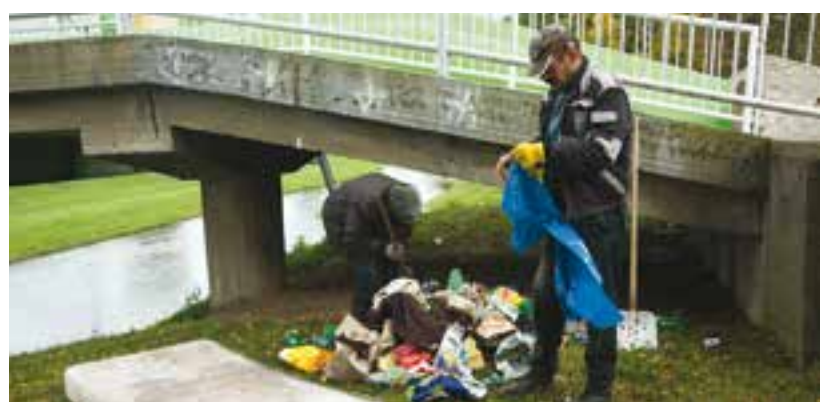
Úklid černé skládky.

Mezi povídáním přichází k lávce a žádá bezdomovce, aby odpadky uklidili. Podává jim s kolegyní nové 120litrové igelitové pytle, ale jako téměř vždy poslouchají výmluvy, že oni nepořádek neudělali a nebudou ho