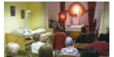
Na archivním snímku mše v kapli v Hospiciu svatého Lazara.

Celkem 1,131 milionu korun poskytne město z rozpočtu na rekonstrukci Hospicu svatého Lazara. Náklady na projekt Bezbariérové řešení Hospicu svatého Lazara v Plzni, který zahrnuje opravu výtahové šachty, výměnu dvou lůžkových výtahů, vybudování bezbariérového WC a výměnu dveří do budovy, činí 5,655 milionu korun včetně DPH. Hospic požádá o státní dotaci, ta může činit až 80 procent předpokládaných nákladů. Zbývajících 20 procent uhradí město.