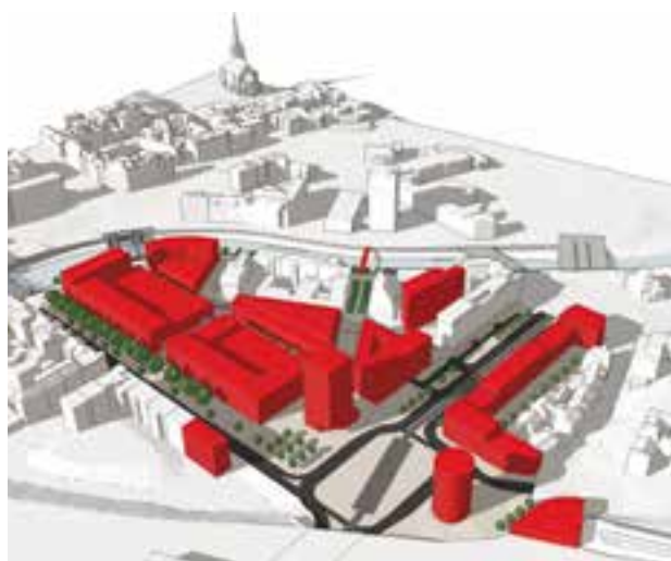
Příklady možných řešení zástavby v území.

V druhé etapě studie řeší doplnění zástavby mezi Sirkovou a Nádražní ulicí a zároveň upravuje uliční profil Sirkové ulice, aby mohl plnit funkci městské třídy.