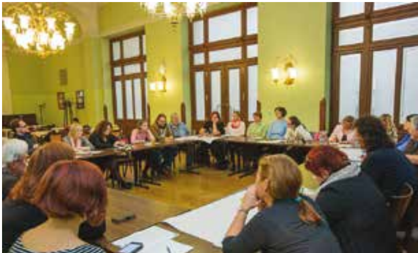
Účastníci Kulturního fóra na jednání v Měšťanské besedě.

Připomněla, že plzeňská kulturní scéna a její aktéři prošli v uplynulých deseti letech dynamickou evolucí a profesionální proměnou, kterou významně posílil i projekt Plzeň – Evropské hlavní město kultury 2015. Plzeň má špičkový umělecký a kulturní potenciál a může se podle