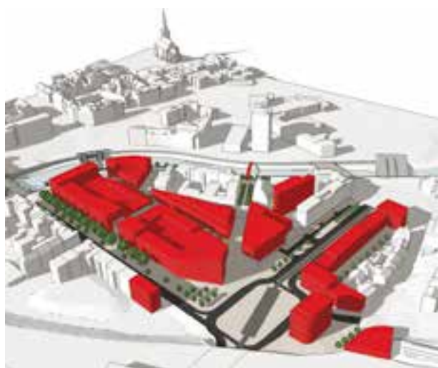
Vizualizace: Útvar koncepce a rozvoje města Plzně

byly hodnoceny další související vlivy například na sektor bydlení, administrativy, kultury a společenské vybavenosti. Výsledky posouzení dopadů jsou vyhodnoceny a zapracovány do územní studie,“ uvádí ředitelka Útvaru koncepce a rozvoje města Plzně Irena Vostracká. (red)