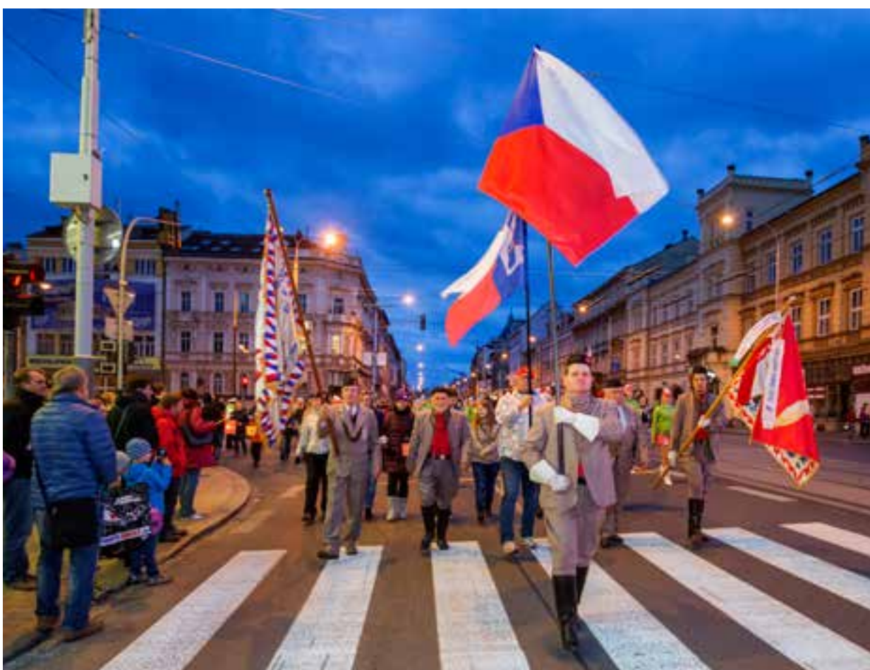
Plzeňské oslavy vzniku samostatného Československa přilákaly v letošním roce i přes nepřízeň počasí 40 tisíc návštěvníků, což je stejně jako v loňském roce. Lidé si užili už tradiční Průvod světél i jízdy historickými vozy městské hromadné dopravy.