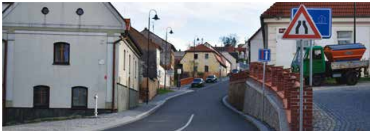
Nově opravená Letkovská ulice.