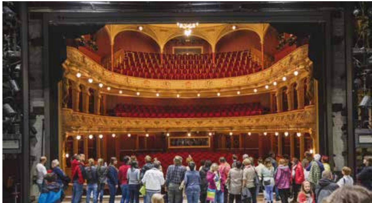
Interiér Velkého divadla v Plzni.

Film vychází ze stejnojmenné divadelní hry o životě dramatika Edmonda Rostanda a vzniku jeho slavného Cyrana de Bergerac. Francouzský dramatik Alexis Michalik hrů sám inscenoval na jevišti pařížského divadla Théâtre du Palais-Royal a ujme se také režie filmu. Ve Francii se jeho hra Edmond setkala s mimořádným úspěchem a získala několik prestižních ocenění. Vzhledem k natáčení bude Velké divadlo uzavřeno od 1. do 29. ledna 2018. „Abonentům Velkého divadla, konkrétně skupin V1, V2, V5, V9, V10, V12 a V14, kteří kvůli pronájmu přijdou o jedno představení, nabízí Divadlo Josefa Kajetána Tyla adekvátní náhradu. Abonmá těchto skupin se oproti předchozím roků skládá ze sedmi představení ve Velkém divadle. Pokud budou mít abonenti zájem,