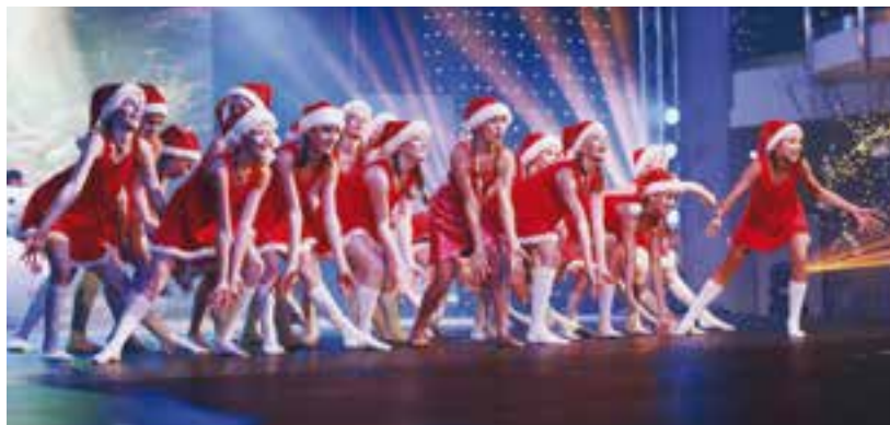
Taneční skupina Storm Ballet.

Kouzlo Vánoc je originálním a nevšedním dárkem, který má v předvánočním