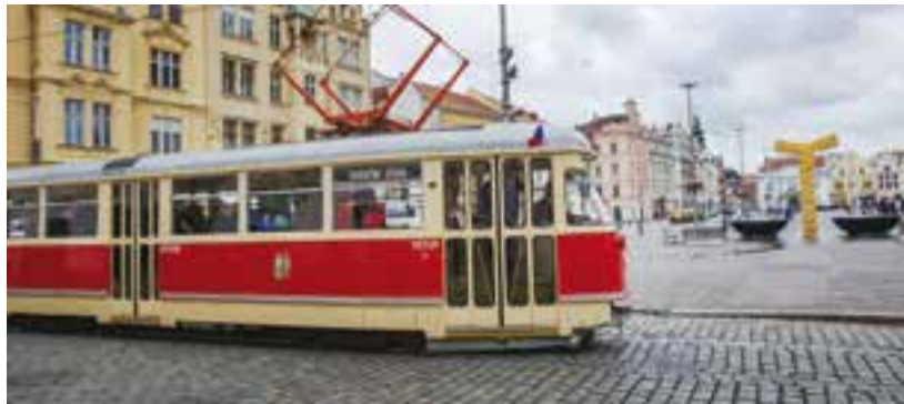
Informace o jízdě historické tramvaje při oslavách vzniku samostatné československé republiky už byly na úložišti.