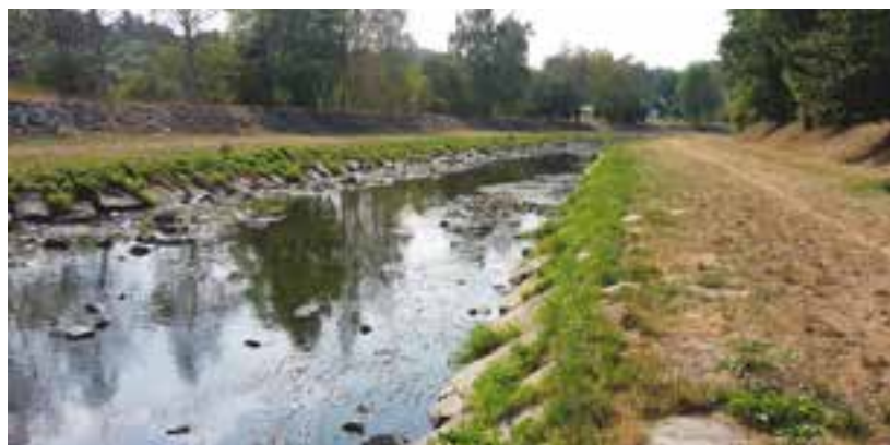
Velmi nízký průtok v řece Úhlavě v srpnu 2015.

Přehradní nádrž Nýrsko, která leží v podhůří Šumavy na řece Úhlavě, je primárně zásobárnou pitné vody pro Klatovsko a Domažlicko. Vzhledem ke svým parametřům a akumulovanému objemu vody však dokáže v případě extrémního sucha nadleňšovat průtok řeky Úhlavy, a tak dotovat nyní