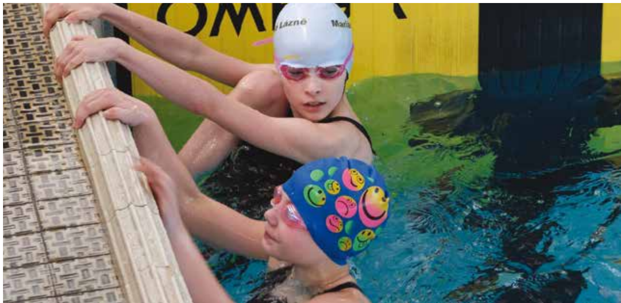
Snímek je z letošního Košařova memoriálu.