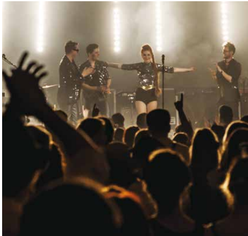
Elektroswing v Pekle.

Právě Plzeň 2015 v současné době provoz kulturního domu zajišťuje. Předloni sem umístila desítky akcí souvisejících s titulem Evropské hlavní město kultury. Nově založila tradici electroswingových tančiren, které se zde konají pravidelně několikrát do roka. Mezi nejúspěšnější akce v Pekle letos patřily koncert skupiny Jelen, divadelní představení Cimrman v řiši hudby a taneční večery „Po sítě swing“ spolu se zmíněnými electroswin-