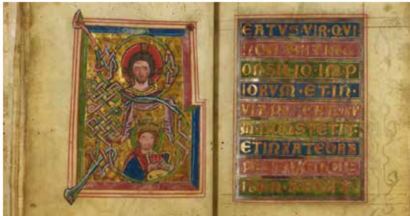
Na snímku jeden z unikátů Archivu města Plzně Osecký žaltář.