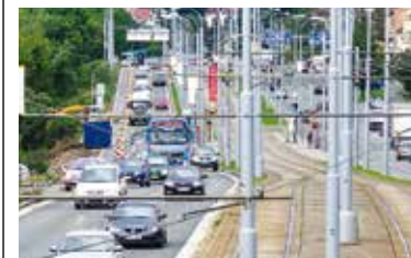
Práce na třetím jízdním pruhu na Karlovarské třídě.

Už v listopadu by měl začít veřejnosti sloužit třetí jízdní pruh na Karlovarské třídě. Vzniká v úseku od křižovatky Karlovarská – Lidická před vjezd na kruhový objezd Rondel. Projekt Plzně za zhruba 13,7 milionu korun včetně DPH realizuje společnost Berger Bohemia, která vyhrála výběrové řízení. Komunikaci se město rozhodlo rozšířit, protože Karlovarská směrem do centra je přetížena, řidiči se tam potýkají s kolonami vozidel. Celková délka rozšířené komunikace bude 580 metrů. Třetí jízdní pruh bude vyhrazen zejména pro vozy autobusů linek MHD i pro vozy autobusových linek provozovaných v rámci Integrované dopravy Plzeňska. Vytvořením třetího pruhu se zlepší dodržování jízdních řádů, sníží se dopad zpoždění na další návazné autobusové spoje vypravované z Centrálního autobusového nádraží. Město zvažuje využití třetího jízdního pruhu ve špičkách i pro ostatní dopravu. (red)