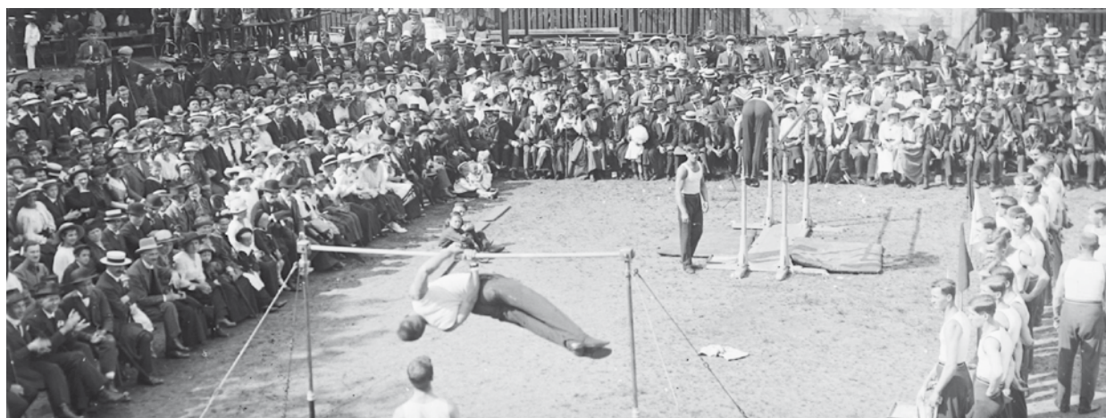
Tělocvičné závody Sokola Plzeň I. v roce 1913.