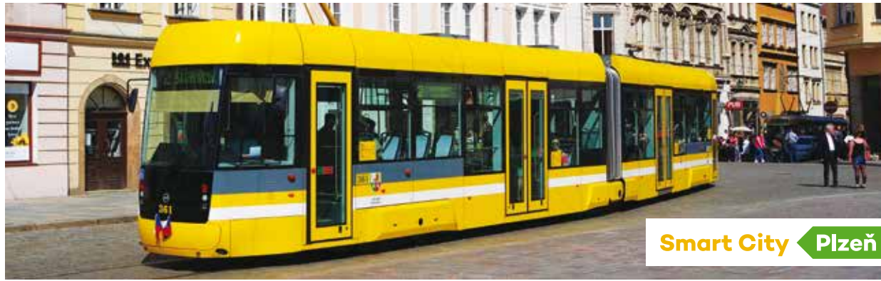
Kamery budou v tramvajích, trolejbusích i autobusech městské hromadné dopravy.

Kamery budou lokálně nahrávat záznamy na vnitřní SD kartu a nahrávky uloží na centrální městské úložiště vždy na konečné stanici, případně v depu pomocí Wi-Fi připojení. Záznamy se tak z kamer dostanou na pulst městské policie většinou s nejdéle