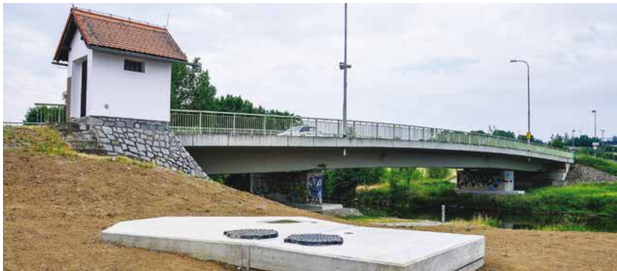
Součást druhé etapy kanalizačního sběrače.

Cílem města je pokračovat dále, to znamená napojovat jednotlivé lokality. Díky této stavbě jsou vytvořeny podmínky pro připojení daných lokalit k odvádění splaškových vod do centrální čistírny odpadních vod v Plzni. Celý Úslavský kanalizační sběrač vede podél řeky Úslavy od Baumaxu na Rokycanské přes střešnici Lobzy a Božkov až do Koterova. „Svoji povahou to nebyla jednoduchá zakázka, museli jsme se vyrovnat s přechodem řeky Úslavy i vysokou hladinou spodních vod. Přesto jsem rád, že se nám toto významné