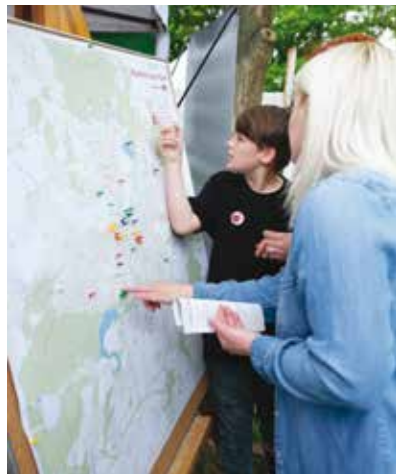
Na snímku Plzeňané při tvorbě pocitové mapy.