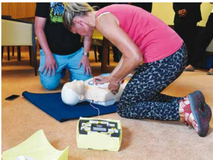
Ukázka použití defibrilátoru.