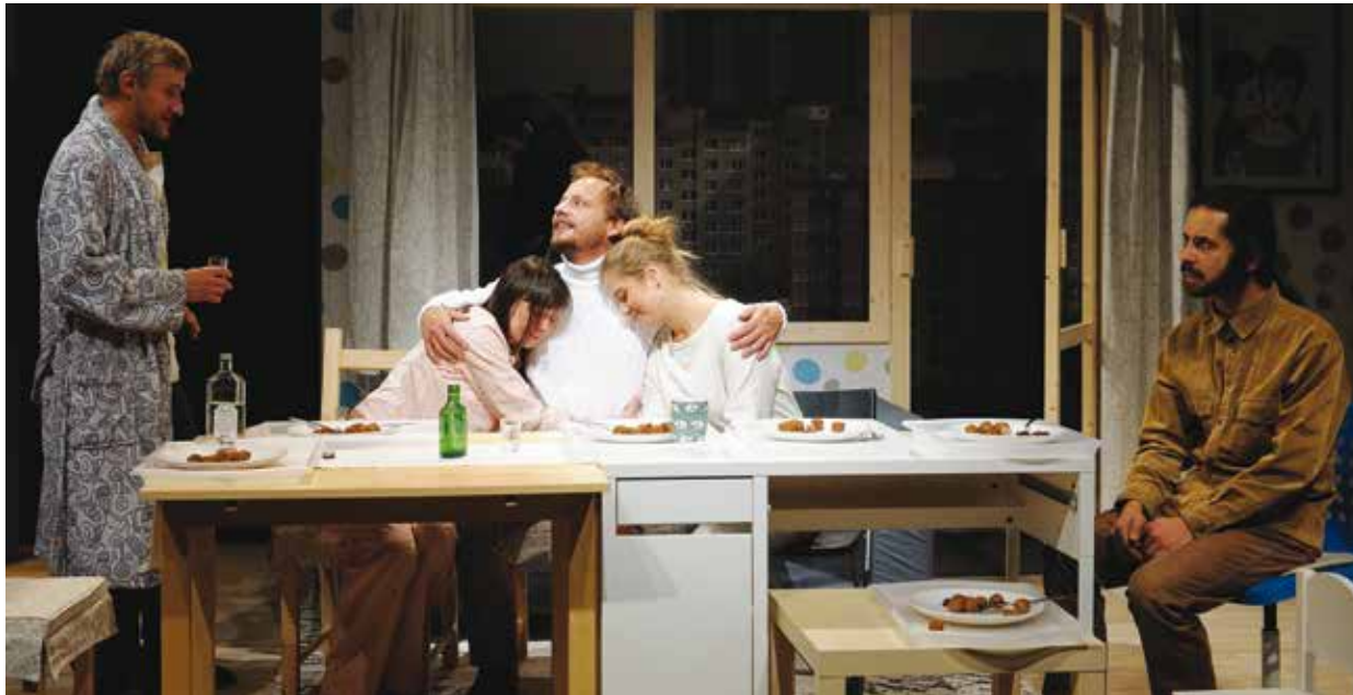
Inscenace Divoká kachna v podání Komorní scény Aréna v Ostravě.